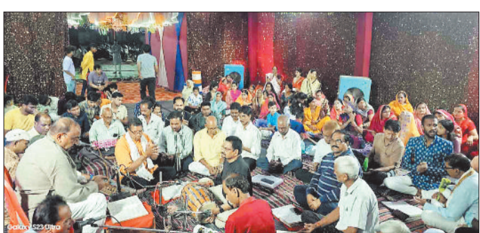
हरिभूमि न्यूज ►► विश्रामपुर

ग्राम जयनगर के बाजारपारा में इस बार भी नवयुवक गणेश पूजा समिति जयनगर ने लगातार 18 वें वर्ष गणेश उत्सव भव्य का आयोजन कर क्षेत्र का माहौल भक्तिमय कर दिया है, यहाँ पर बड़े आकार का 60 फीट ऊंचा पंडाल आकर्षक सजावट और गणमगती रोशनी से सजाया गया है, जिसमें 10 फीट ऊंची श्री गणेश प्रतिमा को विराजमान किया गया है। रंग-बिरंगी