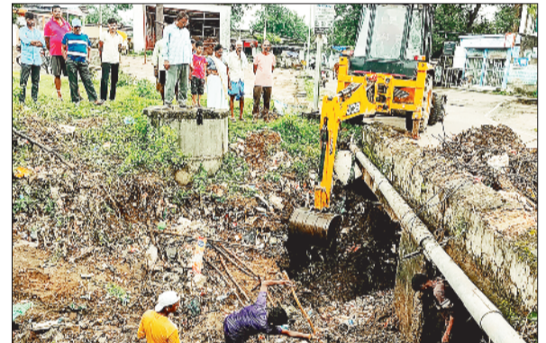
नगरीय प्रशासन की ओर से की जा रही सफाई।