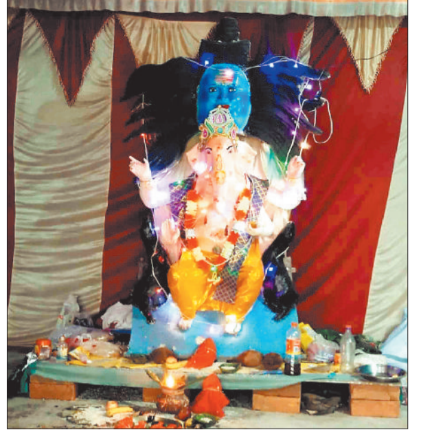
गणेशोत्सव पूजा समिति केतका।