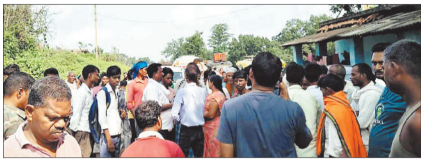
चक्काजाम करते ग्रामीण।

विकासखंड रामचंद्रपुर के ग्राम रेवतीपुर में कोरवा जनजाति के ग्रामीणों की मौत रविवार की शाम घर में हो गई थी। परिजन