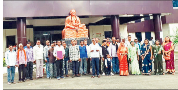
झापन सौंपने पहुंचे लोग।

शिकायत में आरोप लगाया गया है कि सरपंच पति के द्वारा ग्राम पंचायत के सभी कार्य हस्तक्षेप प्रक्रिया जाता है एवं सभी फर्जी कार्यों में उनकी सहभागिता रहती है। कलेक्टर को सौंपे शिकायत में बताया है कि ग्राम पंचायत के सरपंच, सचिव एवं सरपंच पति के