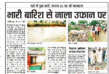
हरिभूमि में प्रकाशित खबर।

कोयलांचल क्षेत्र के शिवपुर चरचा नगर पालिका के वार्ड क्रमांक 4 एवं 5 में लंबे समय से जाम पड़े नाले की सफाई बुधवार से शुरू कर दी गई। पिछले माह 25 अगस्त को मू स ल धा र बारिश में नाले का पानी उफान मारकर झोड़ियाँ और