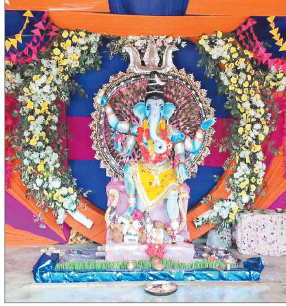
सार्वजनिक गणेश पूजा समिति हाईस्कूल पारा, सुरजपुर।