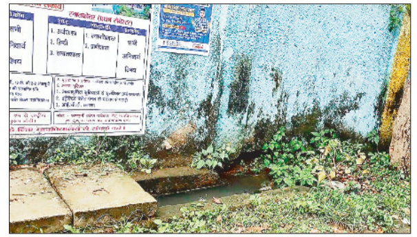
जाम नाली का पानी।

वर्तमान में हो रही बारिश धान फसलों के लिए लाभदायक माना जा रहा है। अमी कई क्षेत्रों में धान की फसलों में बालियां निकलनी शुरू हो गई हैं, वहीं कुछ दिनों से बारिश की गतिविधि कम हो जाने के कारण कई क्षेत्रों में खेतों में पानी की कमी होने लगी थी, ऐसे समय में बारिश होना निश्चित रूप से धान की फसल के लिए लाभदायक है। वर्तमान में हो रही बारिश धान फसलों के लिए अमृत के बारिश के समान है।