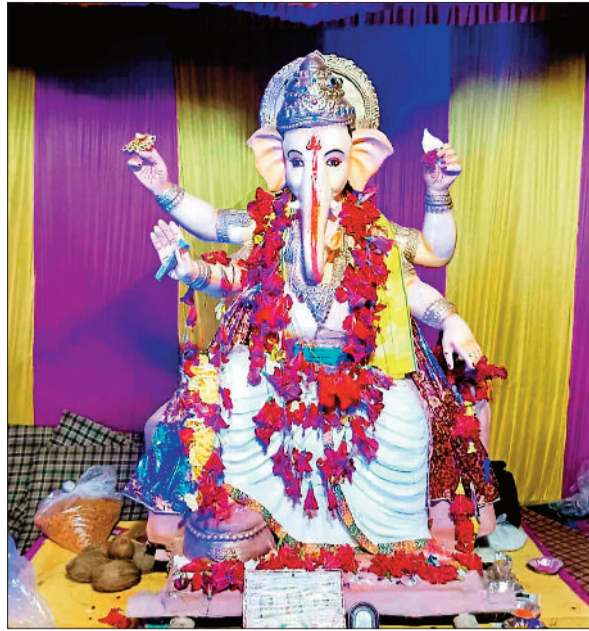
भगवाधारी क्लब गणेश पूजा समिति रामानुजगंज।