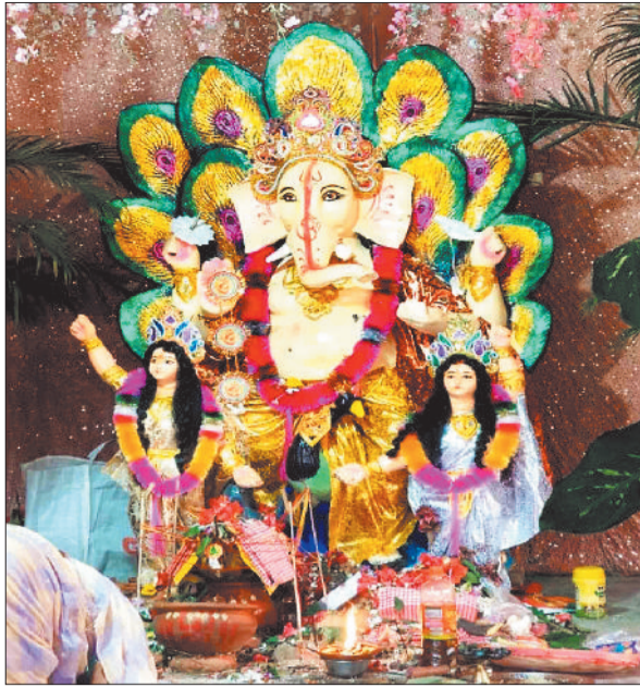
गणेश पूजा सेवा समिति सरगंवा।