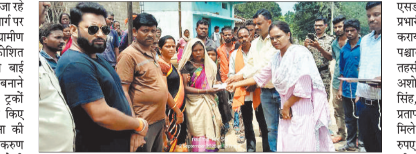
मृतक के परिजन को सहायता राशि देते प्रशासन की टीम।