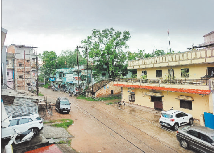
लागतार बारिश से सड़क पर भरा पानी।

जिला मुख्यालय बैकुंठपुर सहित जिलेभर में मंगलवार की शाम के समय से बारिश की शुरूआत हुई और रूक-रूक कर देर रात तक बारिश का क्रम चलता रहा। दूसरे दिन बुधवार को सुबह मौसम खुला, लेकिन आसमान में बादल छाए रहे और उमड़ते-धूमड़ते बादलों के बीच दोपहर के समय जिला मुख्यालय बैकुंठपुर में कुछ देर की झमाझम बारिश हुई, वहीं जिले के कुछ क्षेत्रों में भी इस दिन दोपहर के समय बारिश हुई। इसी तरह शाम ढलने के दौरान भी हल्की रिमझिम बारिश होती रही। इस तरह कोरिया जिले में दो दिन झमाझम बारिश कुछ देर की हुई, जो कुछ समय तक हल्की बारिश होती रही। हालांकि सावन जैसी झड़ी नहीं लग रही है, लेकिन कुछ-कुछ देर के अंतराल में दो दिनों से कोरिया जिले में बारिश का दौर चल रहा है, इससे गर्मी से राहत मिल गई। मौसम विभाग के अनुसार अभी बारिश की संभावना बनी रहेगी।